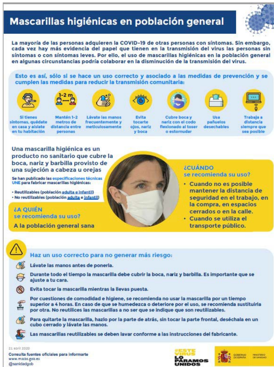
Mascarillas higiénicas en población general (Ministerio de Sanidad, 2020)

Nota: las mascarillas quirúrgicas y las mascarillas higiénicas no son consideradas EPI.